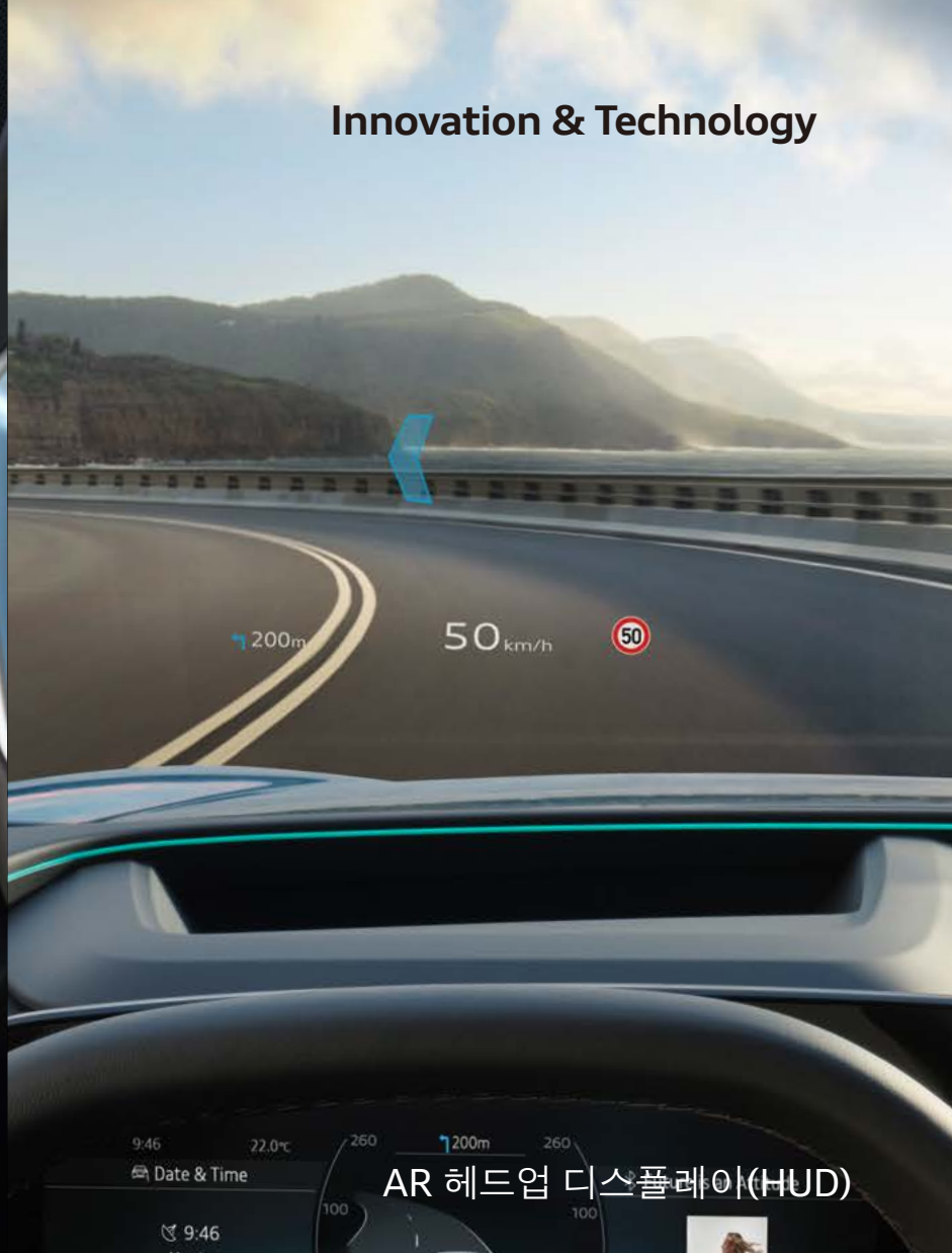
AR 헤드업 디스플레이(HUD)