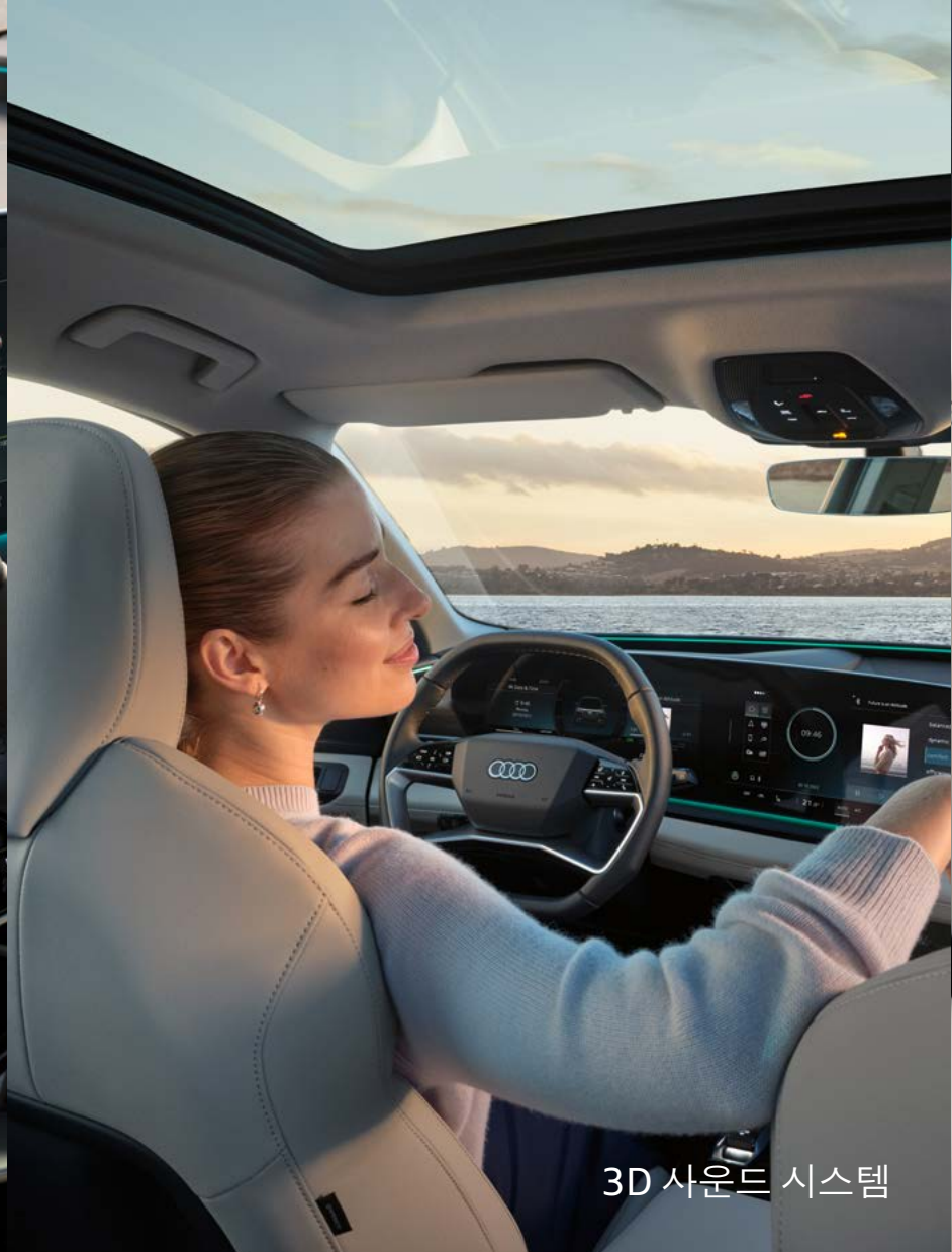
3D 사운드 시스템