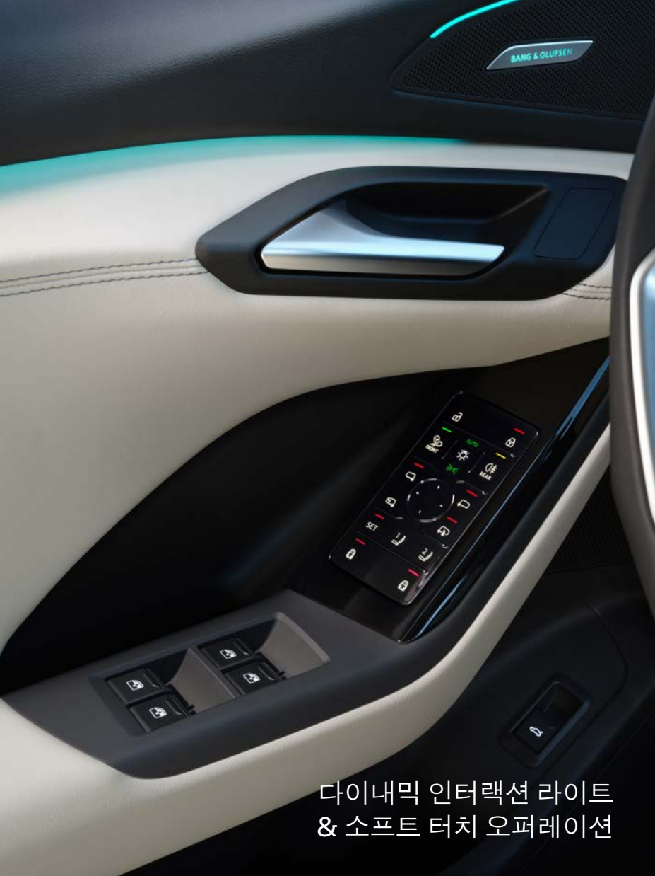
다이내믹 인터랙션 라이트 & 소프트 터치 오퍼레이션